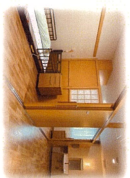
多床室 (プライバシー保護 対応をしています。)

A 開業園のリハビリは、専門性の高い機能回復のリハビリは行っておりません。今現在の状態を出来るだけ長く維持できる様遊びリレーションを中心とした、日常生活リハビリを行っております。