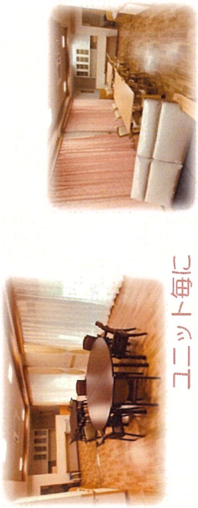
ユニット毎に 特色があります！