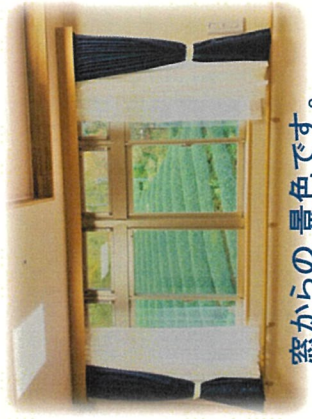
窓からの 景色です。

ご家庭で介護を受けている方が、 色々な都合で一時的に介護が受け られなくなったときに、ご家族に 代わってお世話をさせていただきます。 ご利用出来る方は、要支援1・2 要介護1～5の方です。 365日受け入れしています。 多床室・個室をご用意しています