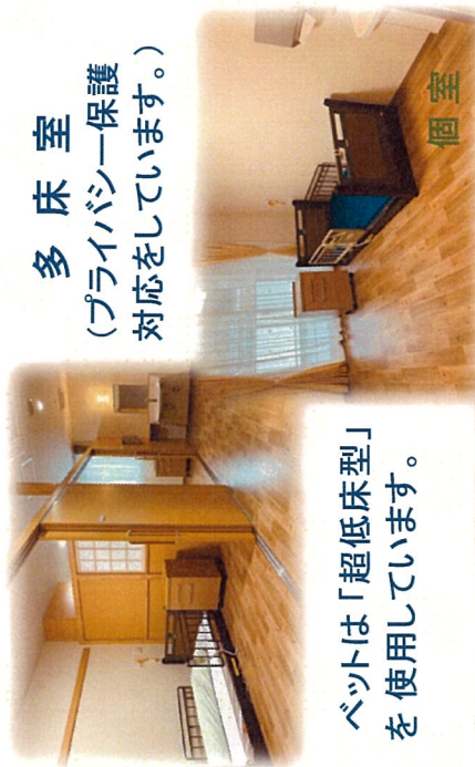
ベッドは「超低床型」 を使用しています。