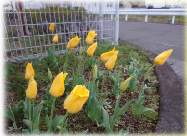
～花壇づくり～ 地域の皆様楽しんでいただけるようチューリップの球根を植えました。綺麗に咲きました。