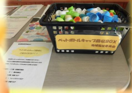
20キロを超える回収の結果となりました。