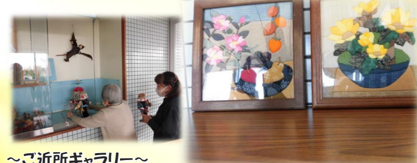
～ご近所ギャラリー～ 地域の皆様のご協力をいただき、素敵な作品を展示させていただいています。