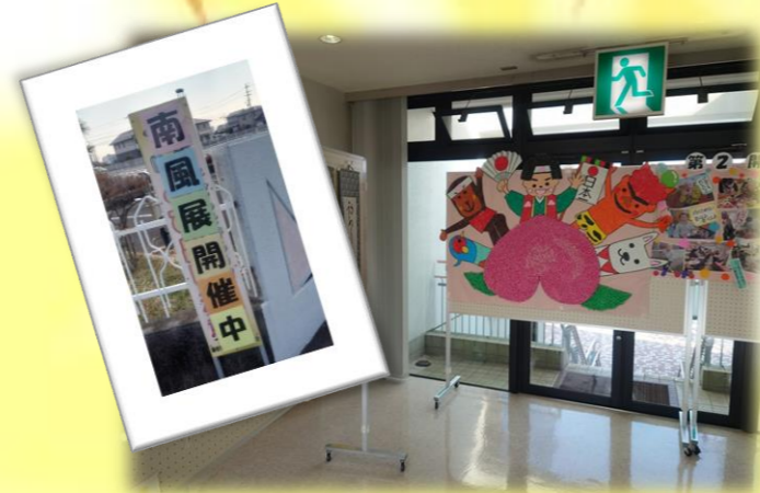
～交流センター作品展に出展～ 利用者の皆様の作品を出展しました。