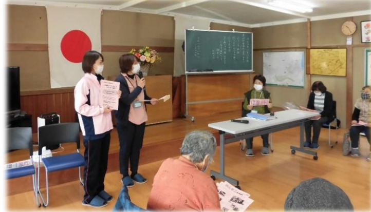
～ペットボトルキャップ回収～ 収地域のサロンにて回収の呼びかけを行いました。

地域福祉委員会では地域の皆様との交流や貢献を目的に以下のような活動を行っています。 コロナ禍ではありますが、地域の皆様との接点を持っていきたくと考えています。